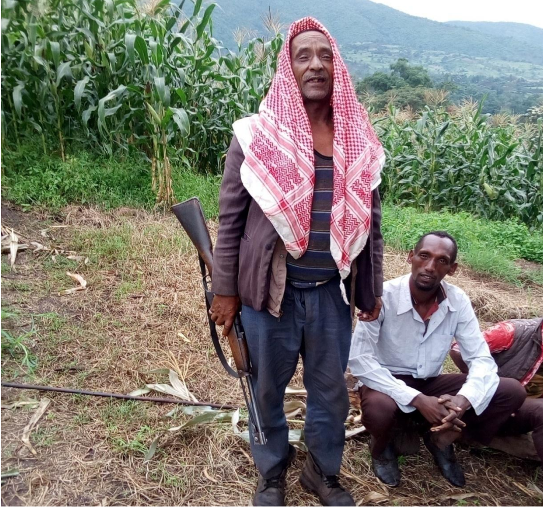
Suura 3:Daawwannaa Ganda Awaash Qolaatii

Geerarsa armaan olii kana qoqqooduun yoo ilaalamu bo'oon afuran jalqabaa ergaan isaa namni gada-doo keessaa bahee qanani'e yookiin inni gabroomee ture yoo bilisoomme guyyaa sana irraa eegaleet waa'een seenaa keessa turee itti dhagahama. Inni aangoo irraa wayta jiru nama cunqursaa tures yeroo aangooisaa irraa kufee qaana'u onneen nama miidhamee ol ka'a. Isa duraan nama irratti geggeeffamaa tures yoos gaabbu. Garuu kuni ta'uu hin qabu duruma qaama rakkoo nama irraan gahu sodaa tokko malee kutannoon itti qabsaa'uun barbaachisaa akka ta'eedha.