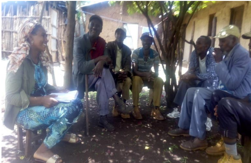
Suura 4 Daawwanna Ganda Harawaa Aanolee