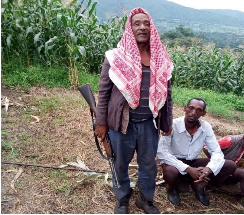
Suura 3 Daawwanna Ganda Awaash Qolaatii